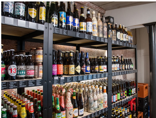
Bierspezialitäten im Mini.Bierladen