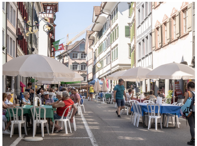
«bunte Tische» der Wilden Weiber Lichtensteig in der dafür autofreien Hauptgasse zwischen den Laubengängen