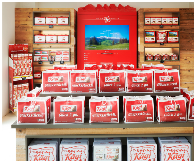
Auswahl an Kägi-Spezialitäten im hauseigenen Fabrikladen.