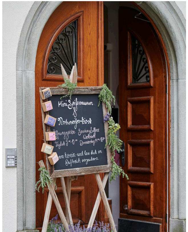
Eingang Toggenburger Seifenmanufaktur