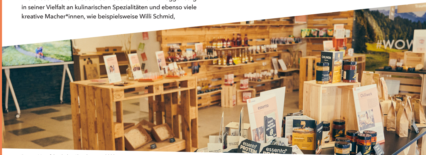
Pop-up Manufakturladen über Sommer 2023

Dank diesem Umfeld sind neue Anbieter*innen dazu gekommen. Vielleicht gerade mit dir und deinem Angebot entwickeln wir das Städtli Lichtensteig weiter als attraktives Genuss- und Manufakturen-Umfeld, für unsere Bevölkerung, die Toggenburger*innen und unsere Gäste. Ein Netzwerk aus genüsslicher Innovation zieht künftig noch mehr Food-Tourist*innen und Genussbegeisterte in unsere Manufakturstadt.